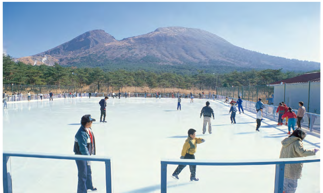
えびの市 屋外スケートリンク

九州最南端の屋外アイススケート場。標高1200mの銀盤では、冠雪した雄大な韓国岳を背景に開放感を味わえます。例年、2月下旬まで滑走が楽しめますが、新型コロナウイルス感染予防対策として、マスクや手袋をお忘れなく！